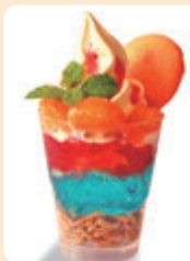
<例>道の駅かしの里

★各種問い合わせ、ライブ&クルーズの申込み 天草西海岸サンセット協議会(下田温泉ふれあい館ぶらっと内) Tel 0969(27)3726 9:00~17:00(第4水曜休)