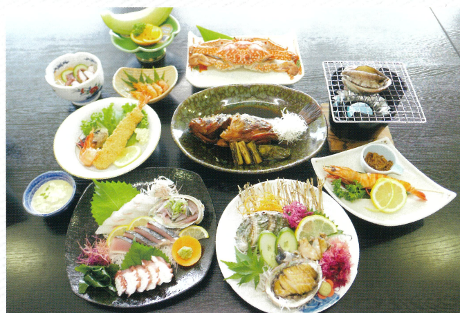
※料理の写真は一例です。