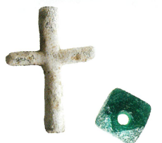
原城で発掘された 十字架とロザリオの珠